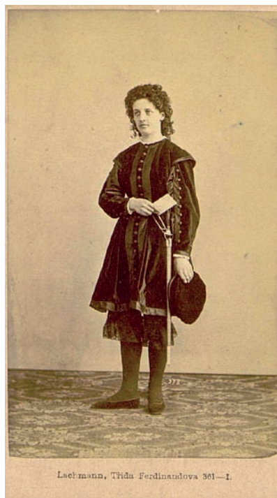
Otýlie Sklenářová-Malá v kostýmu

Mezi portréty nalezneme ze skladatelů především Procházkovy učitele a přítele Bedřicha Smetanu (zastoupen dvěma portréty), Karla Bendla, Karla Šebora, Eduarda Nápravníka, Zdeňka Fibicha nebo slovenského autora Jána Levoslava Bellu. Překvapivě chybí Antonín Dvořák, s nímž byl Procházka v častém osobním kontaktu. Ze světových autorů pak chybí Richard Wagner. Z kapelníků je zde Jan Nepomuk Maýr nebo August Schulze. Z předních sólistů Prozatímního a později Národního divadla Josef Lev, Josef Paleček a Jakub Schwarz. K Procházkovým blízkým přátelům patřil i estetik Otakar Hostinský, filozof a estetik Josef Durdík, podnikatel, mecenáš a otec Emy Destinnové Emanuel Jan Kittl, právník a významný mladočeský politik Julius Grégr nebo právník a tajemník družstva Prozatímního a později Národního divadla Josef Sklenář a jeho choť, herečka Otýlie Sklenářová-Malá (ta je zastoupena jako jedna z mála žen v Procházkově albu). Dále ve fotoalbu najdeme portrét malíře Antonína Waldhausera, žurnalisty Ervína Špindlera, podnikatele a me-