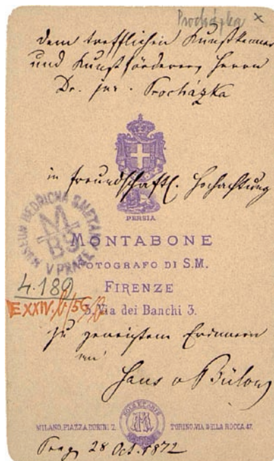
Hans von Bülow – zadní strana vizitky s věnováním