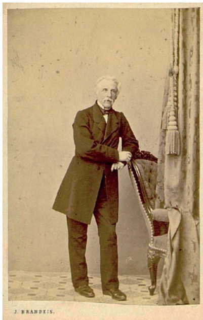
Leopold Eugen Měchura

Dnes je asi nejvíce známa Procházková hudebně kritická činnost. Nejprve převzal po Bedřichu Smetanovi hudební rubriku v Národních listech . V roce 1870 založil a redigoval časopis Hudební listy a poté, co se jich musel vzdát, založil časopis Dalibor . Všechny hudební aktivity stihl při svém povolání magistrátního úředníka. Pracovní povinnosti ho nicméně hodně vyčerpávaly a odváděly od jeho vlastního poslání. Využil proto možnosti odejít v roce 1879 do Hamburku, kde získal místo učitele klavíru na konzervatoři. I v Německu byl pak velmi aktivní v uvádění děl Smetanových a Dvořákových. Mimo jiné se mu podařilo prosadit nastudování Smetanovy opery Dvě vdovy v Hamburku.