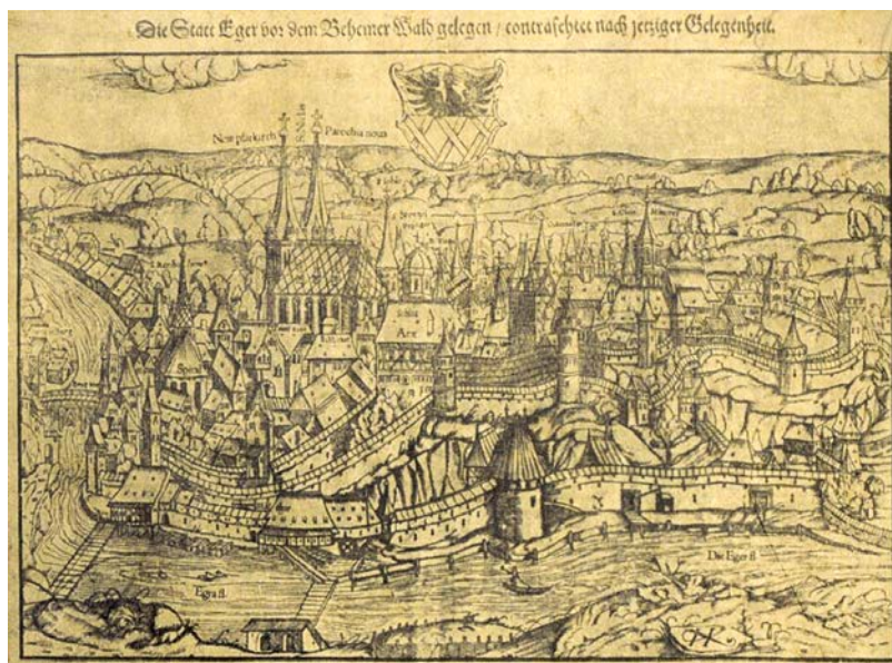
Cheb v roce 1567. Veduta pocházející z místopiseckého díla Cosmographia.

Cheb byl svým politickým statusem a geografickou polohou již od středověku předurčen ke konání říšských sněmů a k setkávání českých a německých panovníků. Právě návštěvy panovníků a politické události konané v Chebu byly vhodnou příležitostí pro provoz nejen vokální, ale i nástrojové hudby. O slavnostech bohatě doprovázených hudbou víme například z doby císaře Zik-