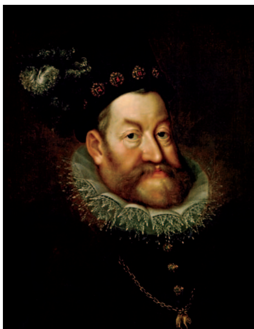
Hans von Aachen, portrét císaře Rudolfa II.

Další informace o činnosti výzkumného centra Musica Rudolphina na: www.bibemus.org/ musicarudolphina/