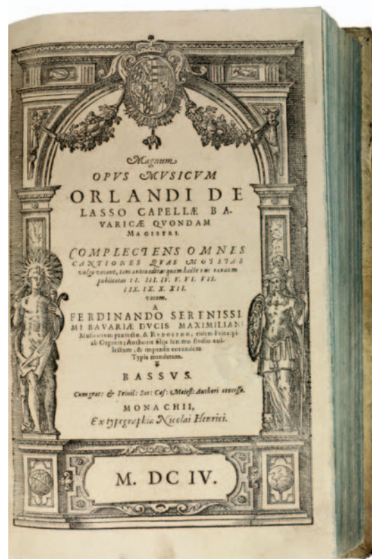
Titulní strana sbírky Magnum opus musicum Orlandi di Lasso (Mnichov 1604).