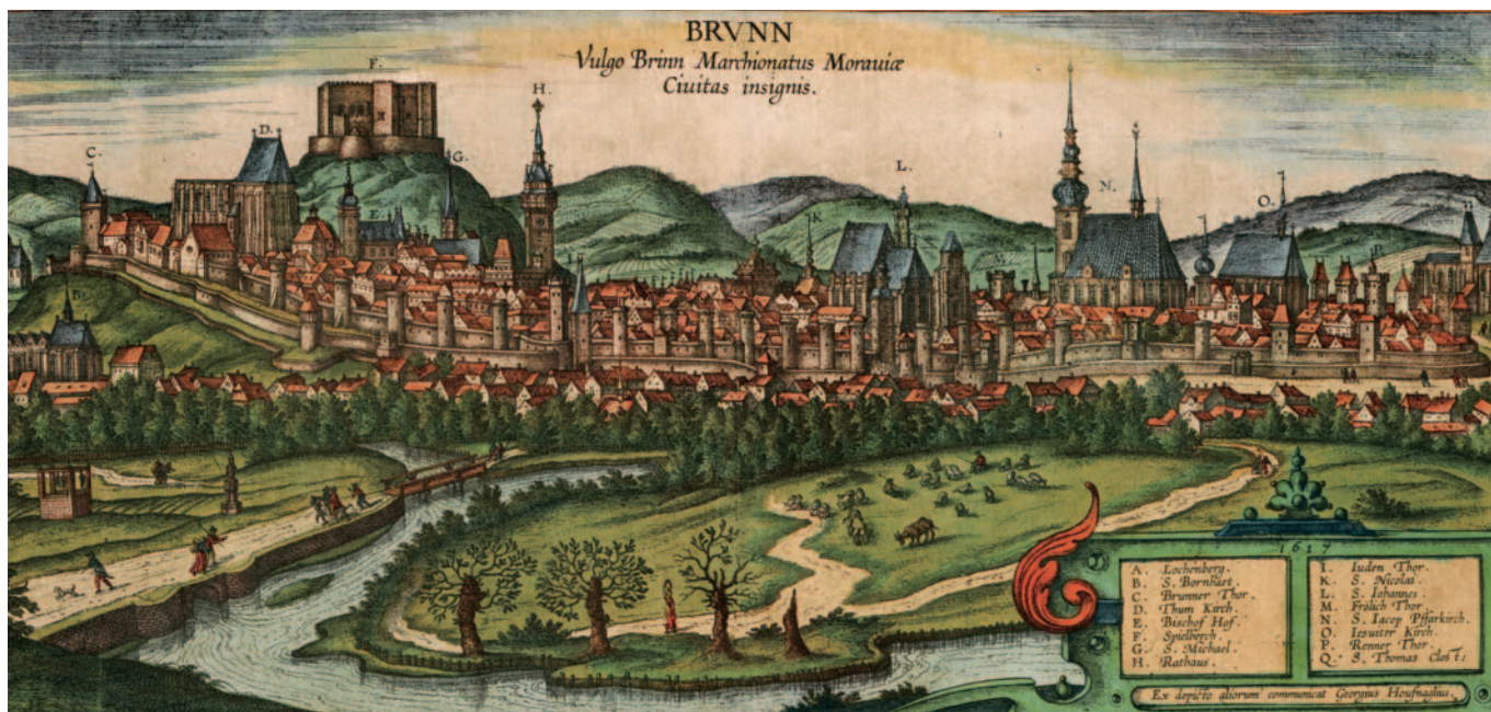
Veduta Brna z roku 1617 na rytině Jorise Hoefnagela.

polyfonně zhudebněná mešní ordinária a propria franko-vlámských renesančních skladatelů. Mimo to přibývaly do svatojakubské sbírky hudebnin také aktuální tisky s vícehlasými kompozicemi, které zasílali městským radám sami skladatelé. Jednalo se o výhodný obchodní tah, kdy tito skladatelé darováním konkrétního hudebního díla dosáhli nejen své sebeprezentace a šíření skladeb se tak často událo napříč středoevropským prostorem (tyto hudebniny byly totiž posléze předány magistrátem na kostelní kůr městského farního kostela, kde se z nich mohlo zpívat). Na druhou stranu však sami skladatelé očekávali za poskytnutý dar finanční ohodnocení. Výše odměny se pak lišila dle možností každého města. V případě Brna zaujímá roku 1606 vyplacená částka 30 zl. bratřím Lassovým za darovanou sbírku Magnum opus musicum (Mnichov 1604) jejich otce Orlanda di Lasso, v té době již zemřelého vévodského kapelníka v Mnichově. Ve srovnání s jinými městy, kam byla tato sbírka rovněž zaslána (Olomouc – 15 zl., Vídeň – 25 zl., Norimberk – 12 zl., Augšpurk – 10 zl., Freiberg – 6 zl. ad.), tato suma skutečně vyniká. Jedině v případě kardinála Ditrichštejna, který obdržel sbírku motet v témže měsíci, jako brněnská nebo olomoucká městská rada, lze doložit stejnou výši odměny (30 zl.).