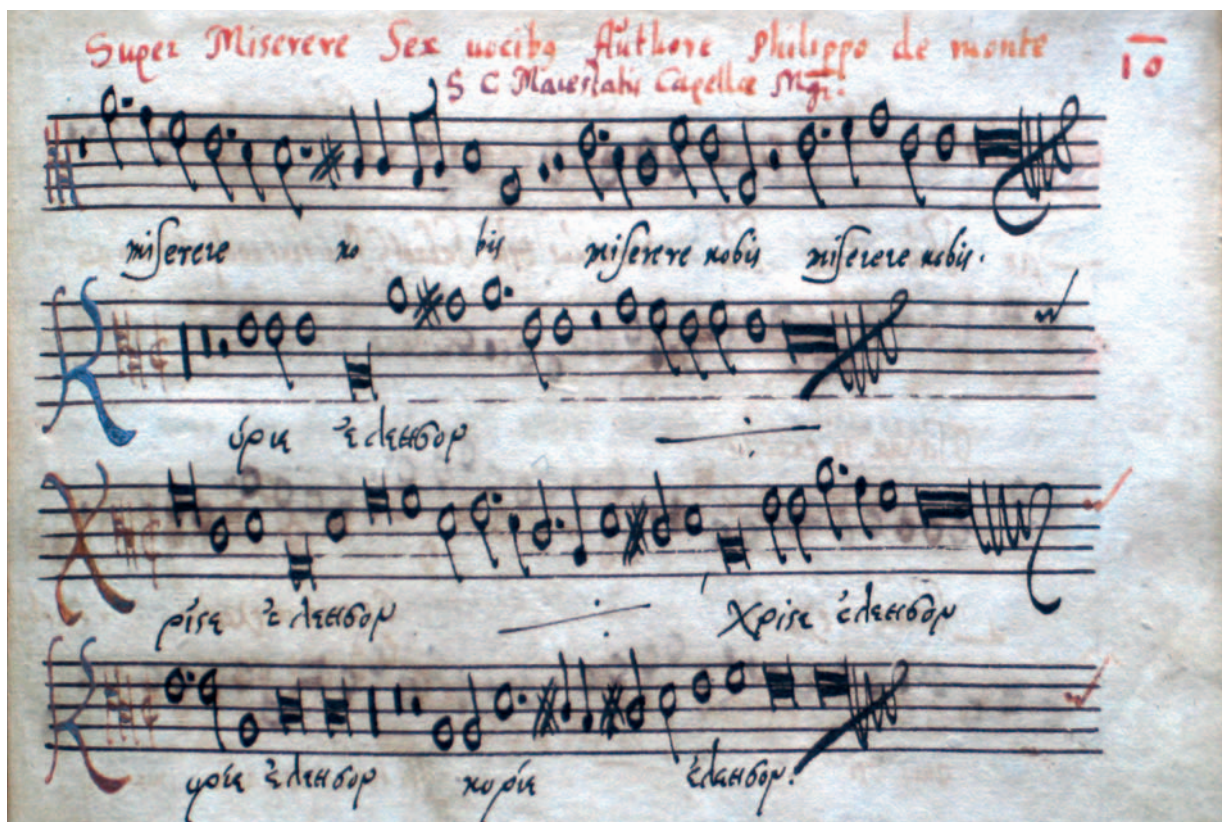
Zápis mše císařského kapelníka Philippa de Monte v rukopisu literátů z Ústí nad Labem.