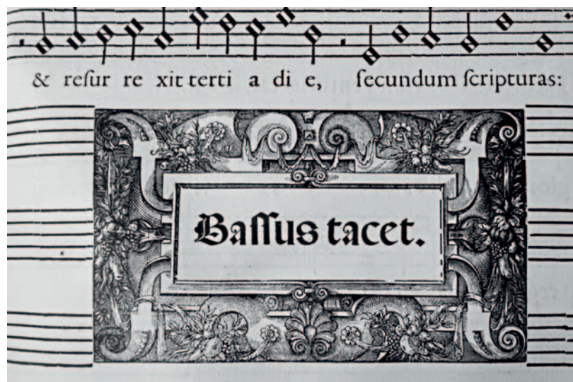
Benešovský kancionál, torzo anonymní písně Vesele zpívajme.

Petr DANĚK a Martin HORYNA (ed.): Dvojsborová moteta rudofinské Prahy. Antologie osmihlasých motet z českých rukopisů a tisků I. / The Double-Choir Motets of Rudolphine Prague. An Anthology of Eight-Voice Motets from Bohemian Manuscripts and Prints I. [Clavis Monumentorum Musicorum Regni Bohemiae, A VI], Praha: KLP 2020, XVI+144 s. ISBN 978-80-87773-73-4