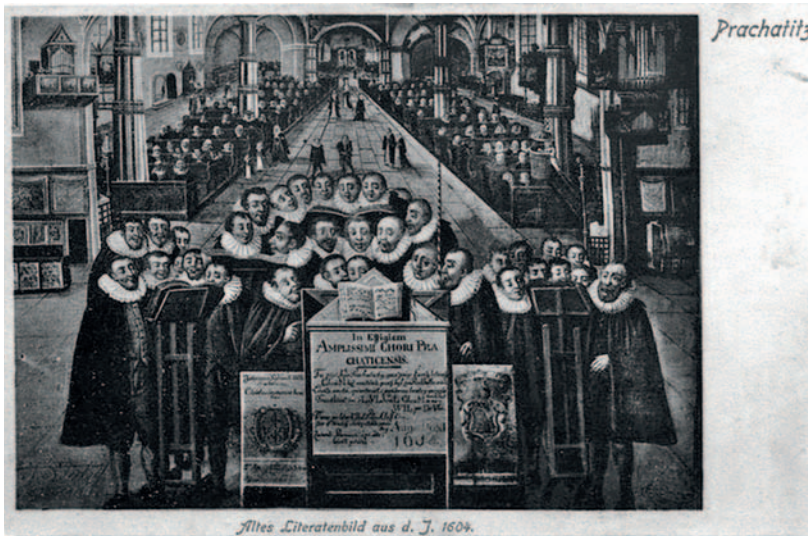
Altes Literatenbild aus d. J. 1604.

Z Trojanovy tvorby se kompletně dochovalo jedno pětilhásé latinské mešní ordinarium Missa super Jerusalem cito veniet , české moteto Jezu Kriste Vykupiteli , 11 českých písní a dvoje česká mešní responsoria. Nekompletně známe ještě 6 českých a 4 latinská moteta, 2 písněové fragmenty, 5 českých plenarií a 7 dalších skladeb pro potřebu utrakvistické bohoslužby (česká Credo, responsoria, sekvence, Sanctus a podobně).