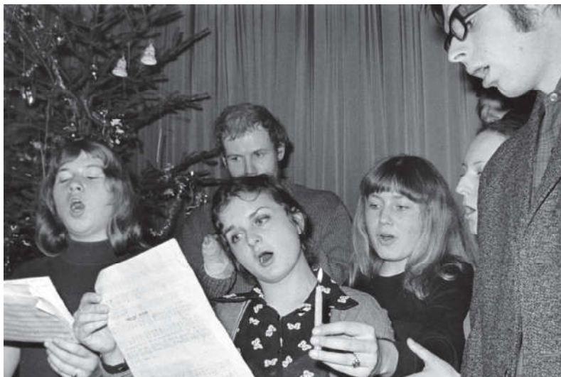
Vystoupení studentského souboru Collegium musicum na vánočním večírku katedry hudební vědy