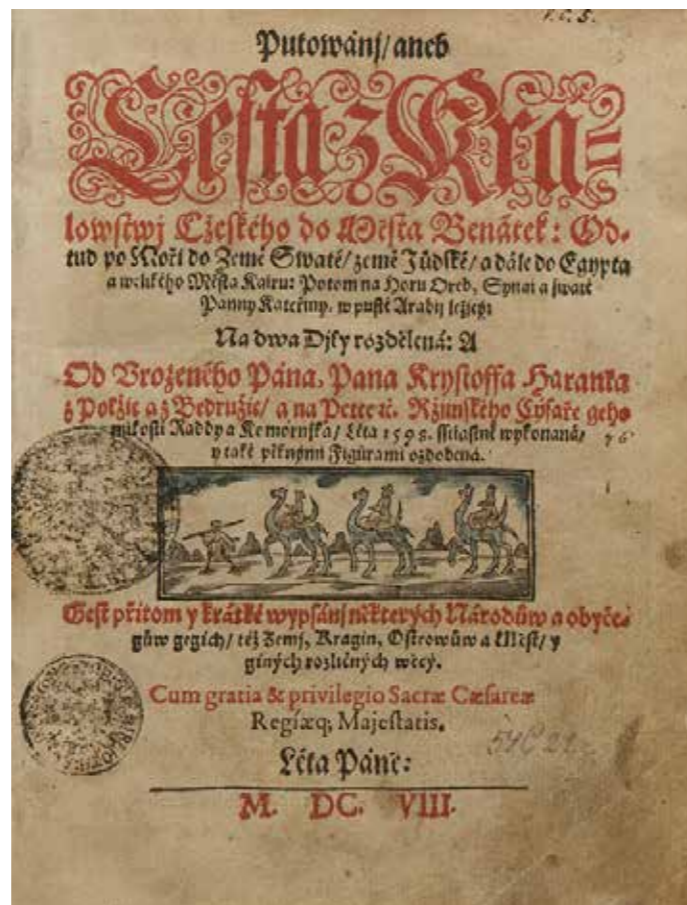
Kryštof Harant z Polžic a Bezdruzic: Putování aneb Cesta z Království českého do města Benátek, odtud po moři do Země svaté, země Jüdské a dále do Egypta a velikého města Kairu, potom na horu Oreb, Sinai a Svaté Panny Kateřiny, v pusté Arabii ležící, na dva díly rozdělená..., Prague 1608, titulní list