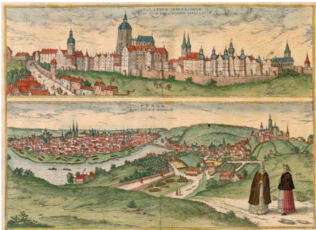
Joris Hoefnagel, Pohled na Prahu, 1593