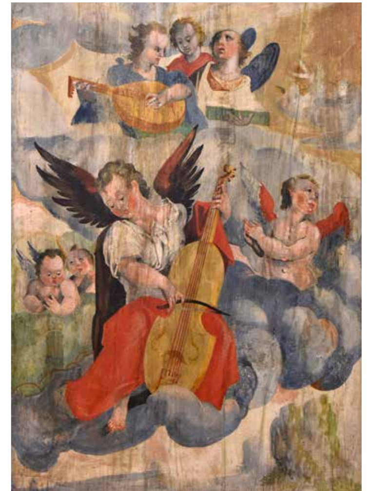
Malba na dveřích renesančních varhan z roku 1587 z kostela Nejsvětější Trojice ve Smečně