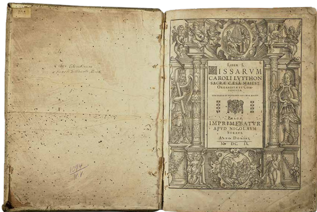
Titulní strana tisku mši

Carola Luythona Liber I. Missarum, Praha 1609