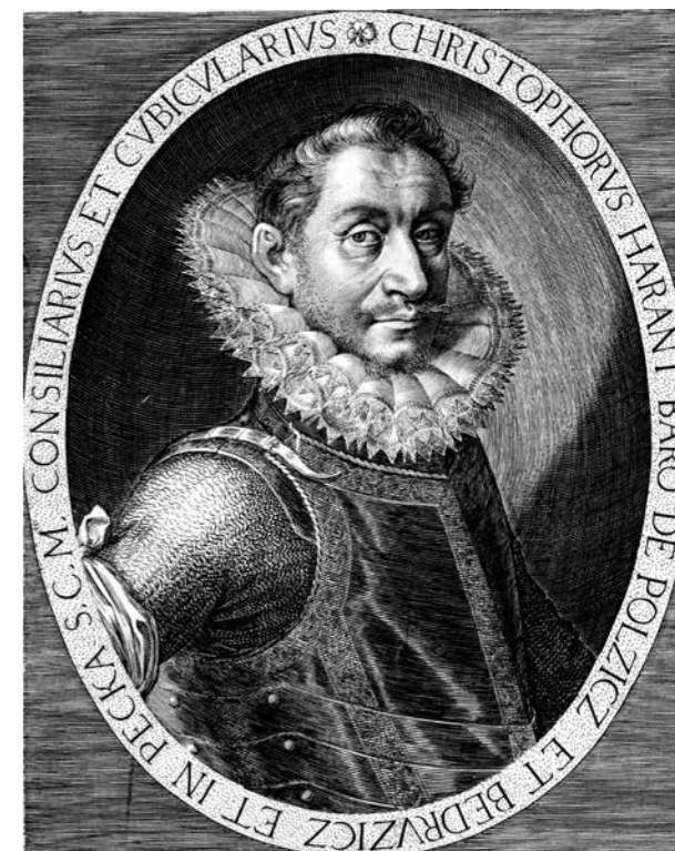
Aegidius Sadeler (1570–1629): Kryštof Harant z Polžic a Bezdružic, ante 1608, mědirytina, in: Putování..., Prague 1608

Při vyslovení jména Kryštof Harant z Polžic a Bezdružic se většině z těch, kteří úplně neprospali povinnou školní docházkou, vybaví přinejmenším jeho neslavný konec při tzv. Staroměstské exekuci v červnu 1621. Před nebezpečím úplného zapomnění ho chrání také jeho jméno, vzbuzující různé asociace a inspirující k všemožným slovním vtipům. Již málokdo si vzpomene, že je také autorem pozoruhodného cestopisu do Svaté země a neméně zajímavým hudebním skladatelem.