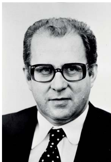
Ladislav Mokřý (1932–2000).