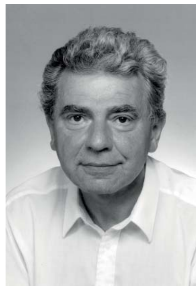
Jiří Fukač (1936–2002).